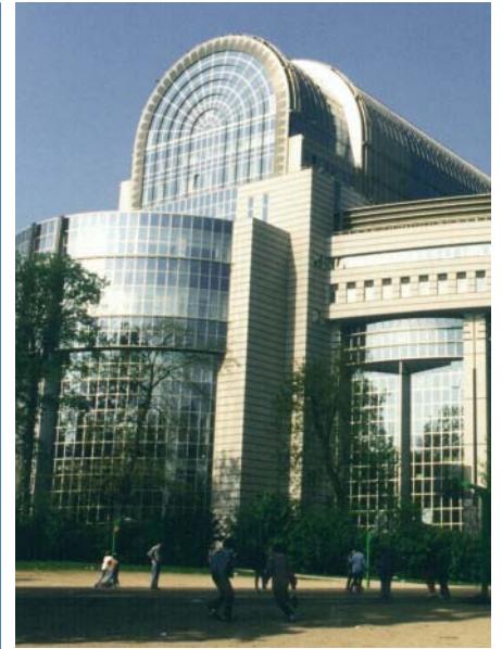
Une présence plus importante à Bruxelles