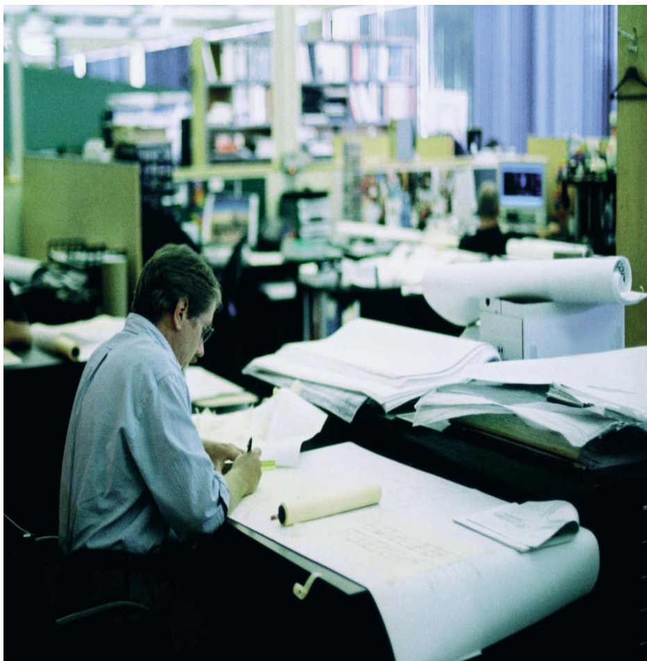
Les conditions de travail ne s'améliorent guère

En se basant sur les données de la Troisième enquête européenne sur les conditions de travail , combinées avec d'autres statistiques nationales et au niveau européen, le service Conditions